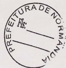
WENSTON PAULINO BERTO RAPOSO Prefeito Municipal de Normandia - PMN